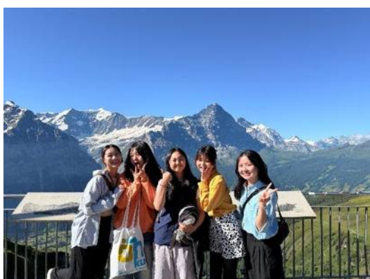
▲瑞士 因特拉肯 First 山