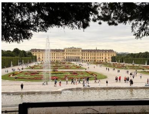
▲奧地利 維也納 美泉宮