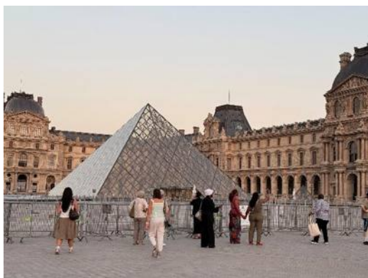
▲法國 巴黎 羅浮宮