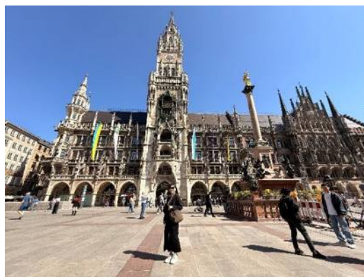
▲德國 慕尼黑 舊市政廳