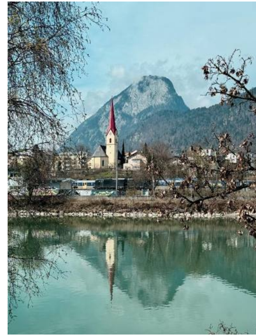
▲庫夫斯坦自然風景