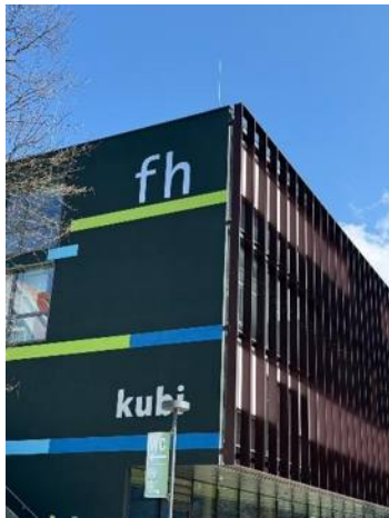
▲庫夫斯坦科技大學建築

庫夫斯坦應用科技大學教學重視小班制、個別化指導與產業實作。許多課程與企業、社區合作，透過專案分析讓學生能夠了解並解決真實問題。有趣的是我聽當地在校學生說出國交換是他們的必修課，因此才去查這間學校的制度發現其與全球超過 200 所合作院校建立交換或雙聯制度，鼓勵學生跨國學習，提升國際競爭力。