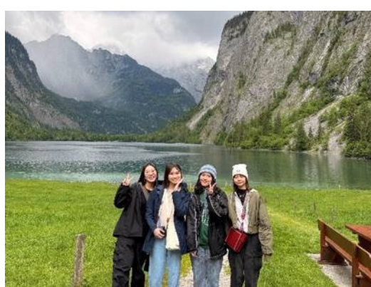
▲德國 貝希特斯加登 國王湖