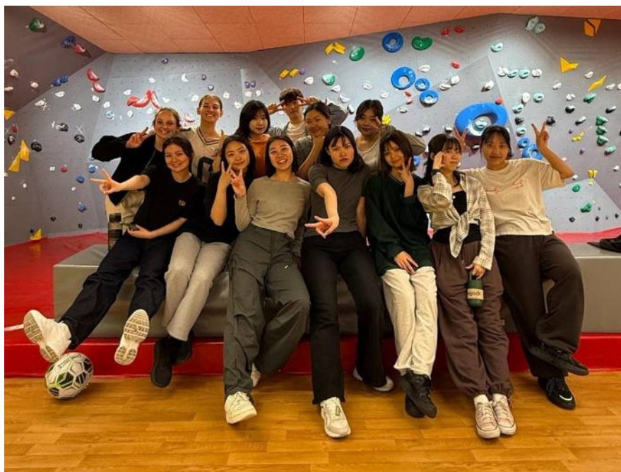
▲ Hip hop

參加完這麼多社團我發現歐洲社團的形式和台灣很不同，不會有人要求強制出席、不會有訓練壓力，不會因為實力好壞被差別對待，也不會因為對手是女生而放水，沒有一次搶到籃板球。社團時間都是以「實戰」為主，而非針對某些能力而加強訓練，更多的是以「玩樂」的心態參加社團，將社團這件事看成是一種休閒活動，反觀亞洲對待社團較為嚴謹、認真，希望參加社團的社員出席每一次的社課，若出席次數太少就會被通緝、警告，在無形之中形成的壓力也扼殺了許多人對體育項目的興趣，這是我覺得比較可惜的地方。