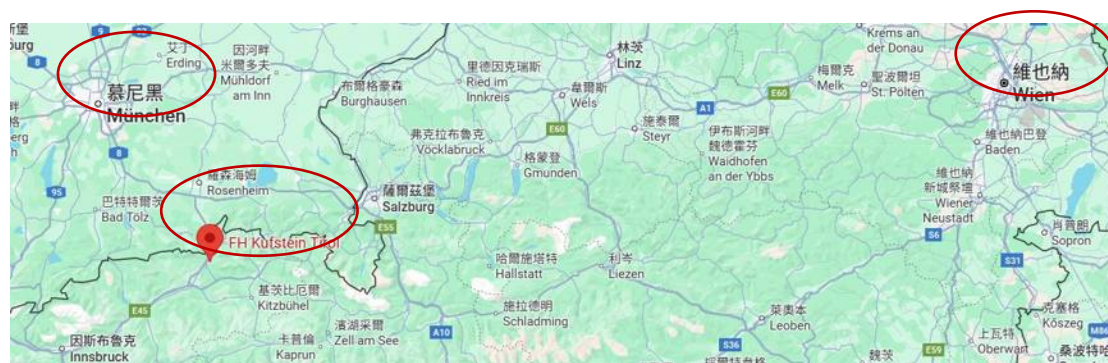
▲庫夫斯坦科技大學與慕尼黑及維也納的地理位置

庫夫斯坦應用科技大學位於奧地利西部的庫夫斯坦（Kufstein）小鎮，離奧地利首都維也納機場搭火車大概要五個小時的車程，庫夫斯坦更靠近德國邊境，距離慕尼黑約一小時左右車程。因此選擇買慕尼黑的機票，再轉兩次車前往庫夫斯坦。搭乘路線：慕尼黑機場 → 慕尼黑中央車站 → 庫夫斯坦。（慕尼黑機場和慕尼黑中央車站不是同一個地方，若要去搭飛機要注意別買錯票、搭錯站！）